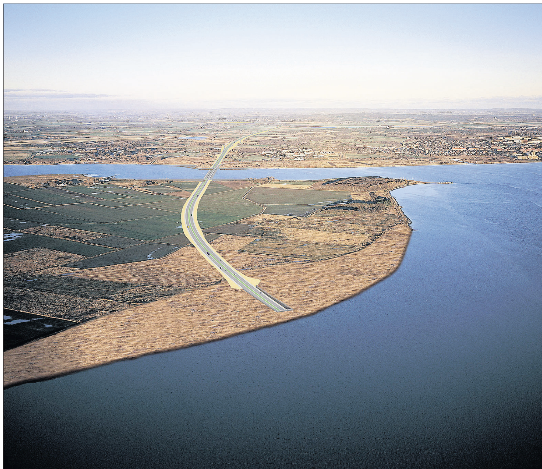
Et flertal på Christiansborg anbefaler, at en ny forbindelse går via Egholm. Men pengene til at etablere den er der fortsat ikke.

Derfor drog deltagerne fra mødet med den opfattelse, at skal OPP-ordningen bruges til at få etableret en tredje fjordforbindelse, må det være det offentlige - formentlig staten - der betaler et pensionselskab for at anlægge vejen. Betalingen for anlæggelsen kan enten ske ved, at staten over en årrække betaler et aftalt beløb. Ellers ved såkaldt "skyggebeta-